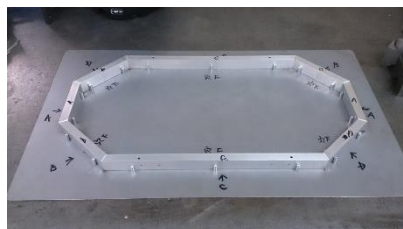
↑アルミパイプの溶接