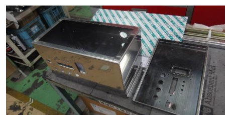
↑ステンレス板金及び組立