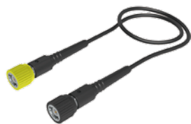
電圧プローブ(1kV以下)