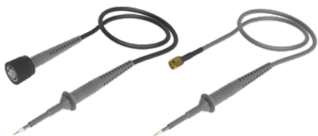
電圧プローブ(1kV以下)【表面実装・狭小ピッチ用】