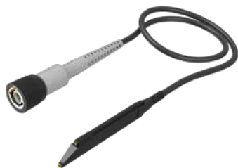
電圧プローブ(1kV以下)【表面実装・狭小ピッチ用】