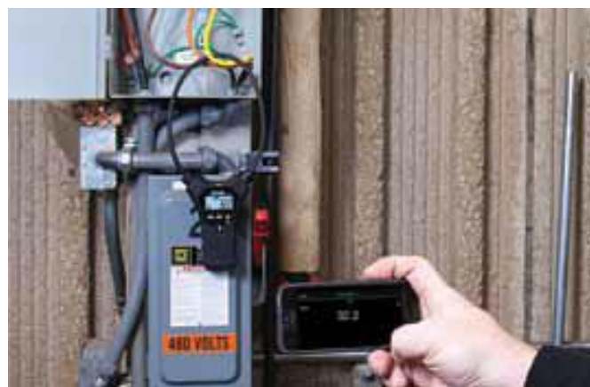
Bluetooth 機能により安全な距離を保ちながら読取値を取得