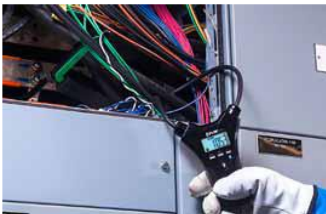
狭い場所にも入れられるフレキシブルケーブル

FLIR Tools を使用して iOS と Android デバイスにデータを転送します。複数の装置をワイヤレスで接続し、複数のシステムを遠隔表示できます。