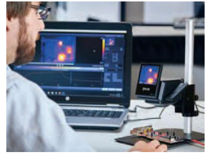
USBでコンピューターに接続し、 FLIR Tools+でデータを分析