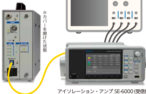
アイソレーション・アンプ SE-6000 (受信側)